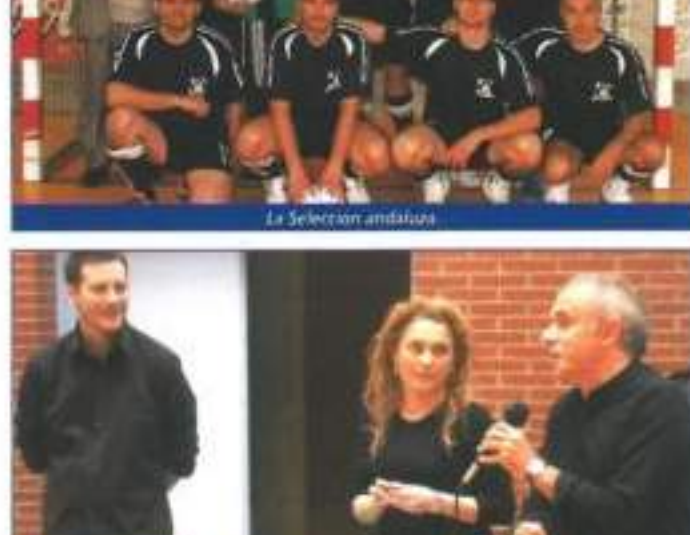
La Selección andaluza

Tras la emoción de los partidos de la mañana del sábado, los