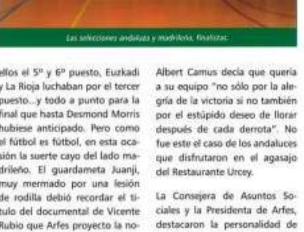
Los seleccionados andaluces y arafesinos.

LA FINALÍSIMA... Y llegó el gran momento. Los aragoneses se disputaron entre