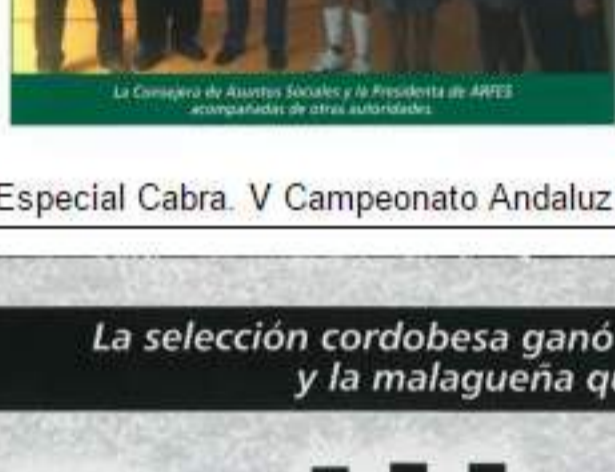
La Comisión de Asuntos Sociales y la Presidenta de ARFES acompañadas de otras autoridades.