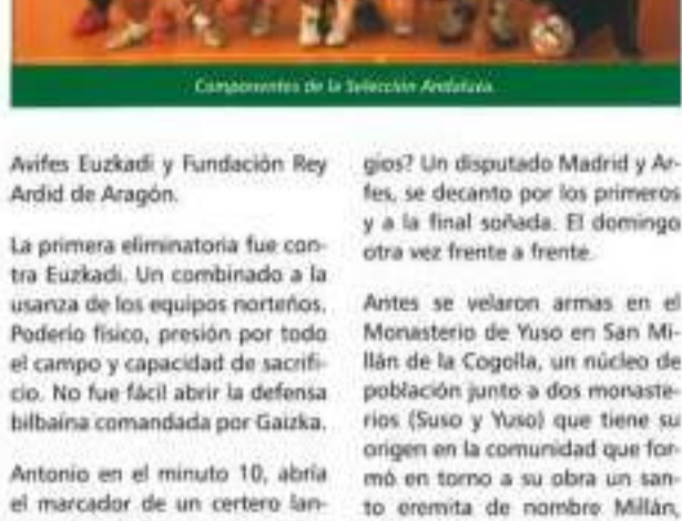
Compañeros de la Selección Andaluza.

Arfes Euzkadi y Fundación Rey Ardid de Aragón.