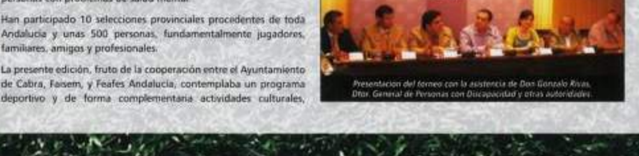
Los días 18 y 19 de junio pasado, la ciudad de Cabra (Córdoba) ha acogido la V Edición del Campeonato Andaluz de Fútbol 7 para personas con problemas de salud mental.

Han participado 10 selecciones provinciales procedentes de toda Andalucía y unas 500 personas, fundamentalmente jugadores, familiares, amigos y profesionales.